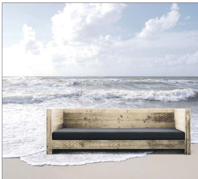
Die Sitzgruppe aus der Lounge-Kollektion von Bauholz design sorgt für Entspannung im Garten.

Die gesamte Kollektion, darauf weist der Hersteller hin, wird von Glasbläsern mit großer Erfah-