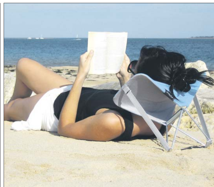
Am Strand entspannt lesen, das ermöglicht Y-Ply.