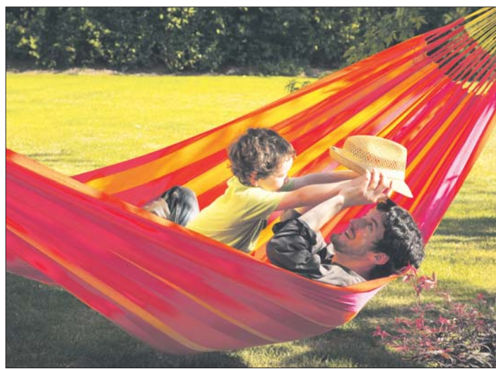
Doppel-Hängematte der Linie Sonrisa in Mandarine.

Kontakt: Bauholz design a.r.t. GmbH, Silke Schuhmacher-Harmeling, Sudmühlenstraße 167, 48157 Münster, Tel.: 0251-2841786, E-Mail: schuhmacher@bauholzdesign.com, Internet: www.bauholzdesign.com. (ts)