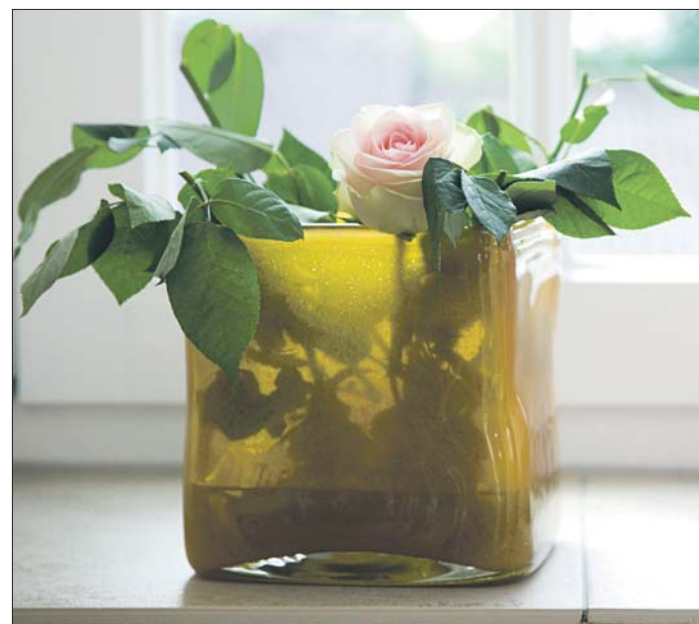
Rechteckig und quadratisch – so die neue Vasenserie „Square“, erhältlich unter anderem in zwei transparenten Trendfarben.

Robust und geradlinig zeigt sich die Sitzgruppe aus der Lounge-Kollektion 2011 von Bauholz design. Der loungige Stil lädt zum Entspannen und Relaxen in Garten, Terrasse oder Wohnzimmer ein. Die textilen Polsterauflagen in den Farben Anthrazit, Cremeweiß und einer Kombination aus