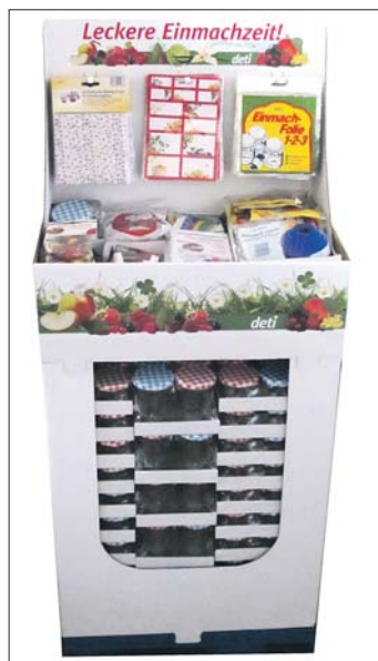
Das Einkochdisplay von Deti.